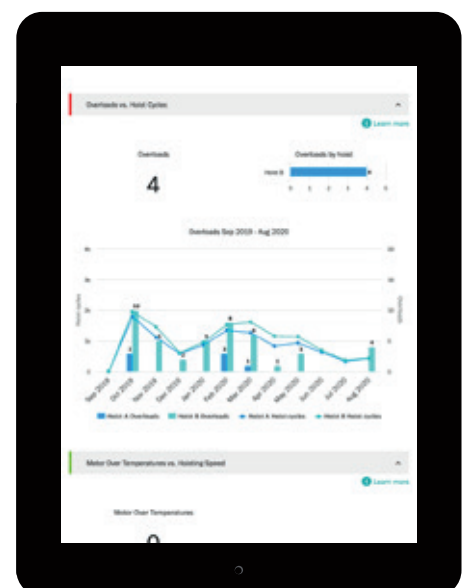
TRUCONNECT Daten im yourKONECRANES-Kundenportal

Die Daten auf yourKONECRANES können schnell eingesehen, analysiert und geteilt werden, damit Sie fundierte Wartungsentscheidungen treffen können. TRUCONNECT Sicherheitswarnungen und Zustandsinformationen sind jederzeit und überall verfügbar. Die Informationen können Ihnen helfen, schnell auf potenzielle Sicherheitsprobleme zu reagieren und Ihre Wartungsarbeiten mit minimaler Beeinträchtigung der Produktion zu planen.