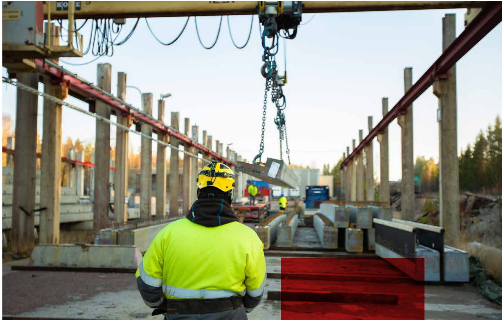
Konecranes suunnitteli nostureiden kunnossapitokokonaisuuden yli kymmenelle Parman tehtaalle. Suunnitelmallinen, ennakoiva kunnossapito auttaa optimoimaan kunkin tehtaan nostureiden huoltotoimenpiteitä ja investointeja.

Parma Oy on Suomen suurin betonielementtien valmistaja. Parma on osa Consolis-konsernia, joka on Euroopan suurin betonitekniikkaan perustuvien ratkaisujen tuottaja ja betonisten valmisosien valmistaja. Parma tarjoaa ratkaisuja sekä talonrakentamisen että infrarakentamisen tarpeisiin. Parma toimii 15 paikkakunnalla Suomessa ja betonielementtitehtaita sillä on 12. Yhtiö työllistää n. 750 henkilöä.